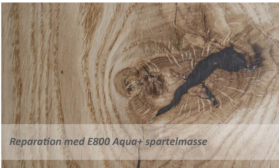
Reparation med E800 Aqua+ spartelmasse